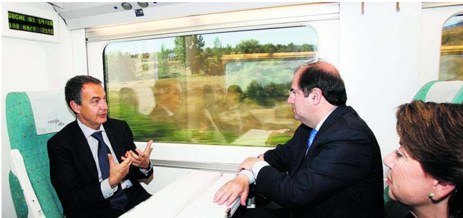
José Luis Rodríguez Zapatero, Juan Vicente Herrera y Magdalena Álvarez, ayer, en el viaje de apertura del enlace sur de León.

Una mujer da a luz en la Calle Ancha con la asistencia de dos policías