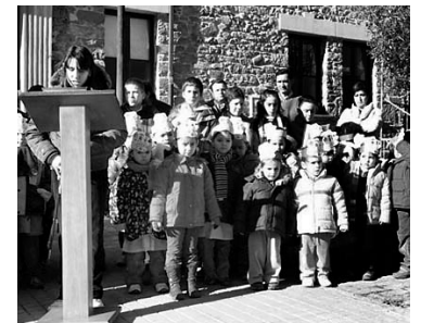
Participantes en el Pleno infantil.

Los niños celebran un Pleno infantil dentro de la I Semana de la Infancia B7