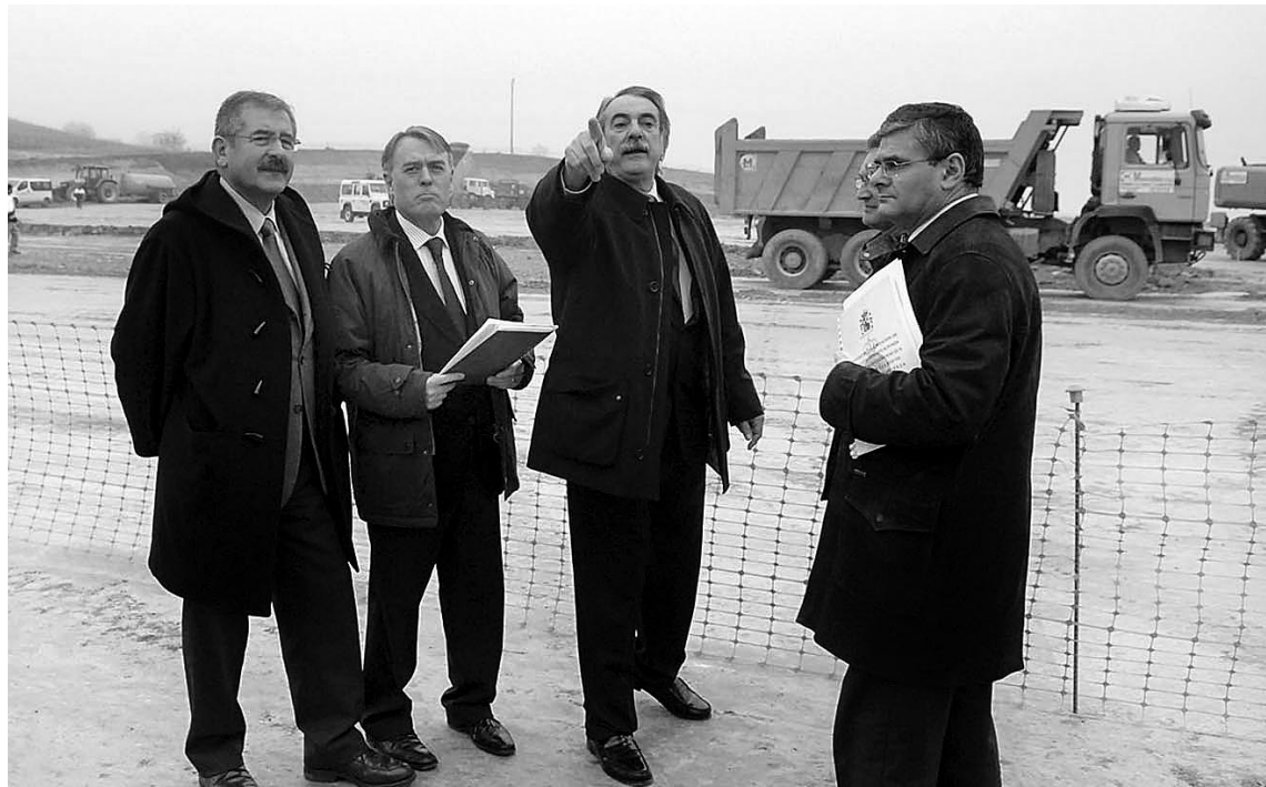
Los subdelegados de León y Lugo y el alcalde de Camponaraya visitaron el nuevo aparcamiento de emergencias. GAZTELU

El subdelegado del Gobierno en León también señaló que en estos cinco años, el Ejecutivo central no sólo ha incrementando las partidas económicas destinadas a este fin sino que además ha duplicado los medios materiales. De este modo, la comarca cuenta con veinte máqui-