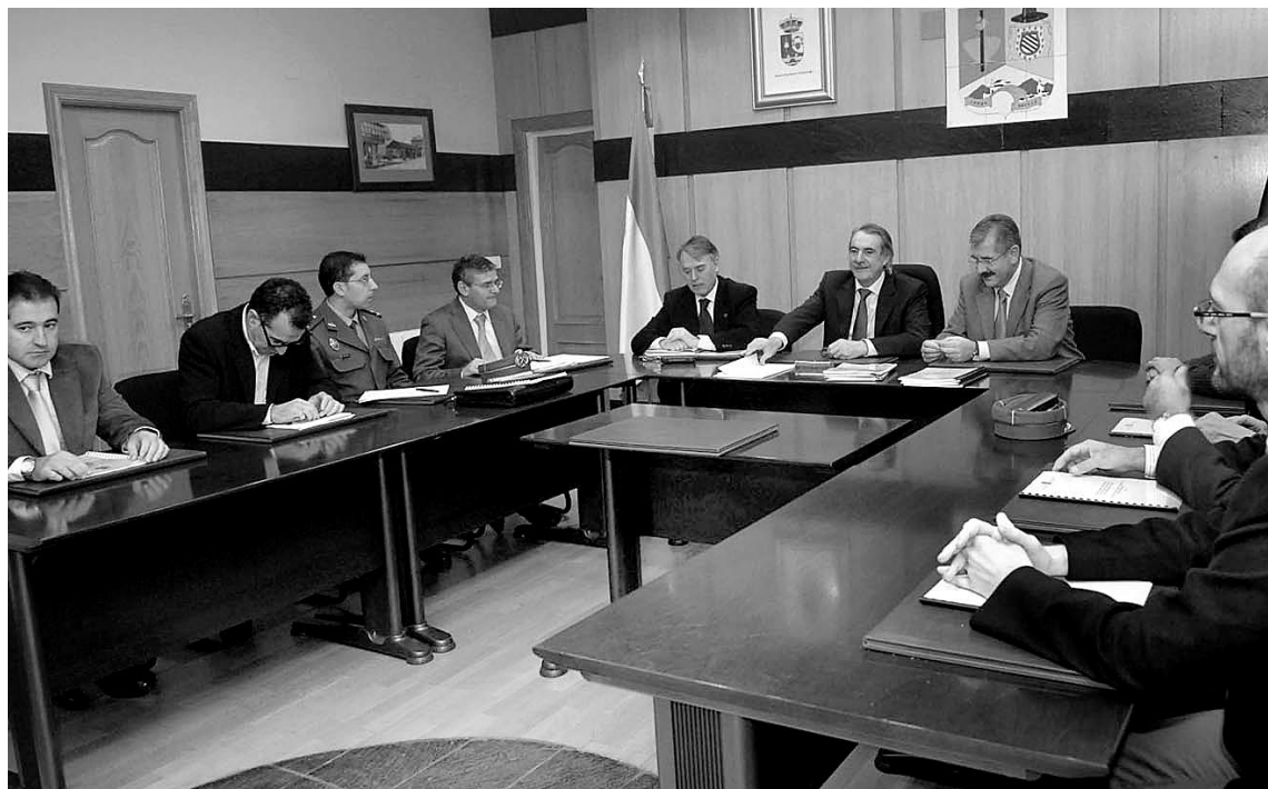
La reunión de coordinación del dispositivo de viabilidad se celebró en el Ayuntamiento de Camponaraya. GAZTELU