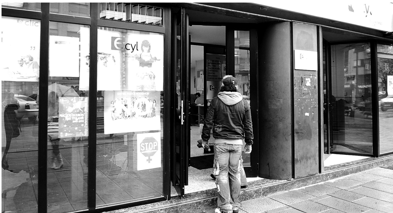
Unos jóvenes entran en la oficina de empleo de Ecycl de Ponferrada, la que más parados registra en todo el Bierzo.

El mes de este año en los que menos paro femenino se ha registrado, según los datos del Ecycl, es, hasta el momento, el de agosto, en el que se contabilizaban 4.586 mujeres desempleadas, (un 59%) hecho que puede justificarse por ser el mes de verano el de más contrataciones en el sector de la hostelería y el turismo en general tanto en la comarca como fuera de ella. Pese al incremento puntual de la oferta de empleo, en agosto ya el paro masculino se había elevado hasta los 3.098 varones sin trabajo, lo que supone 222 desempleados más. Respecto a los varones, el mes de más parados de este año hasta septiembre ha sido el de abril, en el que se alcanzó la cifra de 5.551 hombres en paro (el 31,3% de las 8.070 personas paradas). Es de prever que la tendencia de acercamiento de las proporciones de paro entre hombres y mujeres siga manteniéndose este mes de noviembre, puesto que el desempleo mayoritariamente ocupado por los hombres sigue sufriendo el azote de los recortes empresariales.