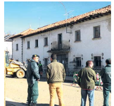
La demolición empezó ayer.